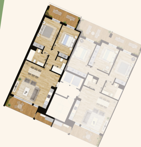
Piscina | Pool