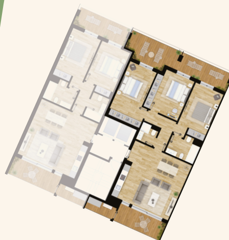
Piscina | Pool