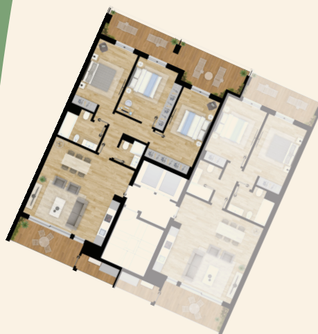
Piscina | Pool